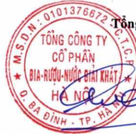
Ngô Quế Lâm